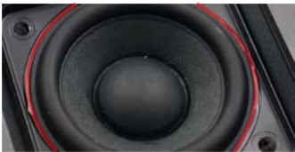
喇叭盆纸粘接 聚氨酯反应型热熔胶

是一种聚氨酯反应型热熔胶，与空气中的湿气发生聚合反应，固化形成高强度胶体。施胶后在初始固化阶段即拥有良好的粘接强度，开放时间相对较长。完全固化后，具有优异的延伸率和结构耐久性。耐冷热冲击性能极佳，用于粘接各种基材，适用于工业生产中的结构压合和电子装配应用。