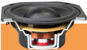
喇叭音圈粘接 环氧树脂胶粘剂

单组分环氧树脂胶粘剂，可在70°C低温下快速固化，不损害不耐热的精密电子元器件，对大多数金属和塑料基材都有优异粘接性能。AE1101储存稳定性佳，有较长的点胶操作时间，能够满足高效生产需求。